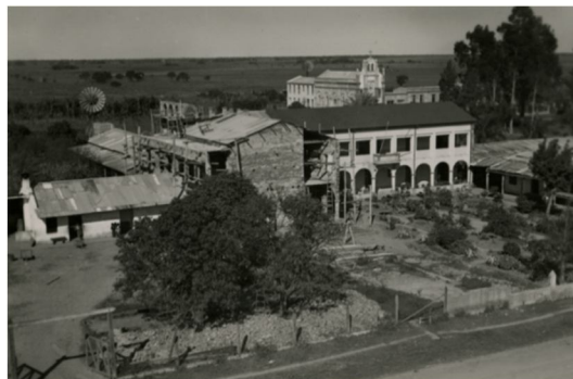
Fig.4. Vista desde el ingenio Azucarero del Escuela hogar San Francisco.

En este complejo se ubica el museo en donde funcionó un juzgado y registraduría, construcciones elevadas desde 1930. En la actualidad es un gran conjunto edificado en donde una pequeña parte funciona como escuela, sin embargo en su mayoría se encuentra en abandono, su recorrido evoca el tiempo y espacio detenido, se observa su sencillez edilicia que es su gran aporte. El museo no tiene reconocimiento normativo en la nación Argentina, sin embargo su manifiesto social cultural valida su existencia, trasciende la ley vigente.