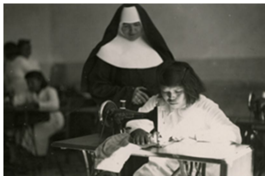
Fig.7. Escuela hogar Santa Clara hermana y nativa.

Las hermanas en la actualidad permiten la visita al edificio, cuentan la memorias de ese lugar, que ya no cumple ninguna función y que amenaza ruina, siendo testigo de una historia social aun no relatada, Los dormitorios comunes se ubican en el sótano de la edificación lo que contribuiría a su refrigeración por las altas temperaturas, el "mejor aporte" para los años 40 del siglo XX en esta región por parte de las hermana Educacionistas fue la enseñanza del español a las niñas aborígenes.