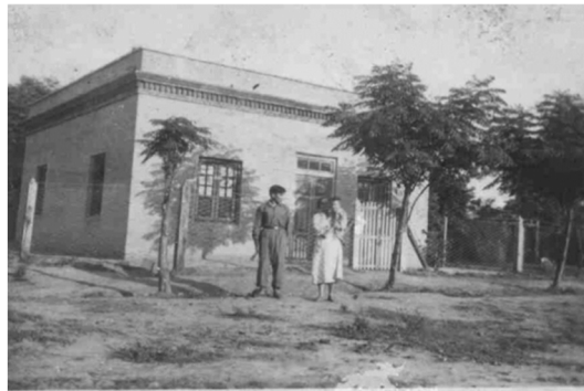
Fig.9. Casa colonos, 1.930-40

esfuerzos sobrehumanos para sacar adelante la producción, es así que desde Noruega el barco a vapor denominado Bratesborg el día 7 de julio del 1.916 llega al puerto de Buenos Aires con el nuevo trapiche para la Misión del Laishí. Dentro del ingenio se encuentran otros espacios como la panadería y la herrería que además cumple la función de bodega, en todos los usos se encuentra mano de obra indígena, en el año 1946 el ingenio cierra sus puertas por las importaciones al país de azúcar, altos costos de materia prima entre otros factores. Con el auge del aserradero, el obraje y el ingenio Laishí desde el año de 1.930 se convierte en un atractivo para nuevos colonos y empieza a conformarse su perfil urbano, con casas que aún en pie muestran su delicada arquitectura.