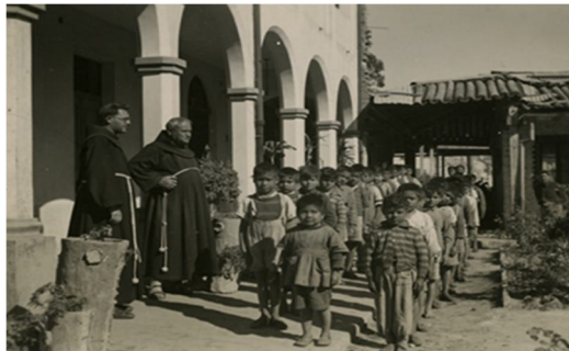
Fig.3. Imagen escuela hogar San Francisco.

En 1920 la escuela de San Francisco se convierte en Internado para niños indígenas, con el fin de extinguir definitivamente el nomadismo, además de la urgente y continua necesidad del cuidado de huertos de pan coger, ganado, siembras en extensión y aserradero lo cual permite el sustento de la misión.