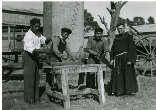
Fig.8. Ingenio Azucarero / aserradero: "Trabajo continuo".

Un detalle constructivo interesante se encuentra en el almacenaje del producto, tanto de la caña de azúcar como el maíz, es una estructura en madera que se eleva a 80 centimetritos del suelo con el fin aislar del suelo y conservar los productos, además de ventanillas con reja para ventilación para crear un microambiente seco. Los ladrillos cuneiformes cocidos para un mejor ensamblaje fueron concebidos para la chimenea, cuya parte más ancha se expone al exterior para un mejor trabajo de la misma, su molde especial y fabricación se realizó con obraje de la misión, es decir, con manos nativas.