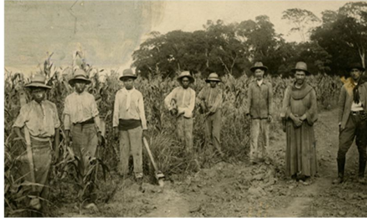
Fig.2. Indígenas en labores de agricultura para la misión.

aledaños al convento de San Francisco en la actualidad son resguardos según Decreto Ley Nro. 1025 del 30 de marzo de 1981.