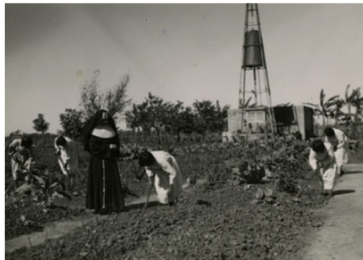
Fig.6. Escuela hogar Santa Clara.

La constante preocupación de los franciscanos fueron las niñas naturales, en este sentido se contrata en 1934 a las hermanas Educacionistas Franciscanas de Cristo Rey, llegan desde Yugoslavia 3 representantes de la comunidad a empezar su labor, con la apertura y puesta en marcha del internado para niñas en la Escuela Santa Clara.