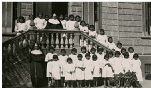
Fig.10. Hermanas educacionistas y niñas nativas en el acceso principal convento Santa Clara, 1.935.