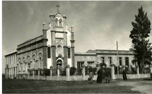
Fig.5. Escuela hogar Santa Clara.

La constante preocupación de los franciscanos fueron las niñas naturales, en este sentido se contrata en 1934 a las hermanas Educacionistas Franciscanas de Cristo Rey, llegan desde Yugoslavia 3 representantes de la comunidad a empezar su labor, con la apertura y puesta en marcha del internado para niñas en la Escuela Santa Clara.